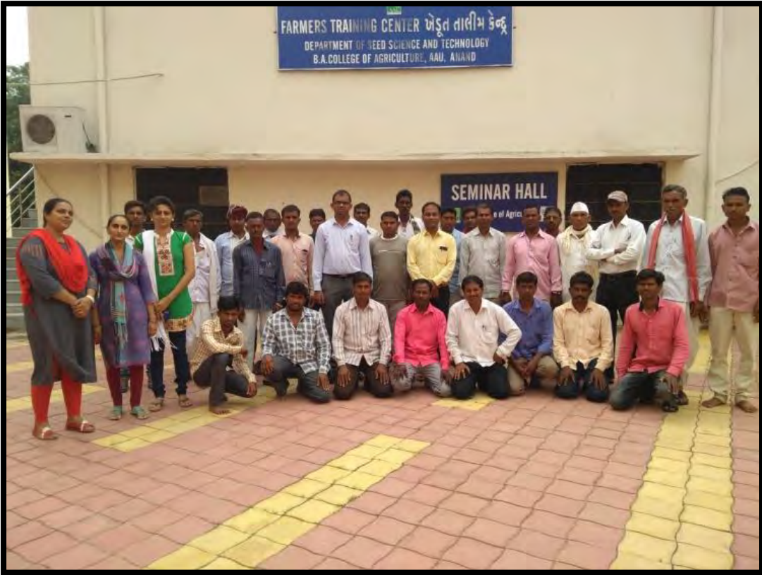
તાલિમમાં આવેલા દાહોદ જિલ્લાના ખેડૂત તાલીમાર્થીઓનો ગૃપ ફોટો

આ તાલીમમાં ખેડૂતોએ ખૂબ સારો પ્રતિસાદ આપ્યો હતો. તેમણે અંતમા જણાવ્યું કે તેઓ અગાઉ મકાઈ જેવા પાકમાં જી.એમ.- ૬ જાતનું બિયારણ ઉત્પાદન કરતાં હતાં જેથી આ તાલિમથી તેમને સંકર પાકોના બીજ ઉત્પાદન તથા અન્ય પાકોના બીજ ઉત્પાદન વિશે ખૂબ ઉંડાણ પુર્વક સમજણ મળી છે. આ તાલિમ તેમને આર્થિક રીતે ખૂબ લાભદાયી થશે.