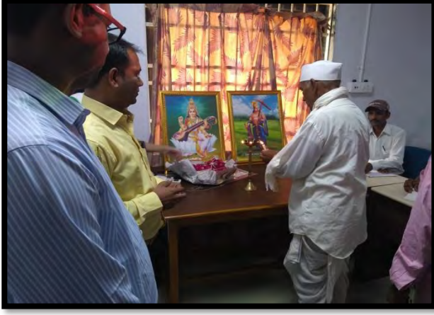
ખેડૂતો દ્વારા દિપ પ્રાગટ્ય