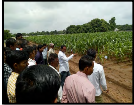
મુખ્ય મકાઈ સંશોધન કેન્દ્ર અને બીજ ઉત્પાદન પ્લોટની પ્રત્યક્ષ મુલાકાત