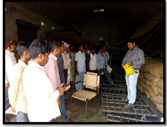
ગુજરાત રાજ્ય બીજ નિગમ (ગોધરા) ની કચેરી અને સીડ પ્રોસેસીંગ પ્લાન્ટની મુલાકાત