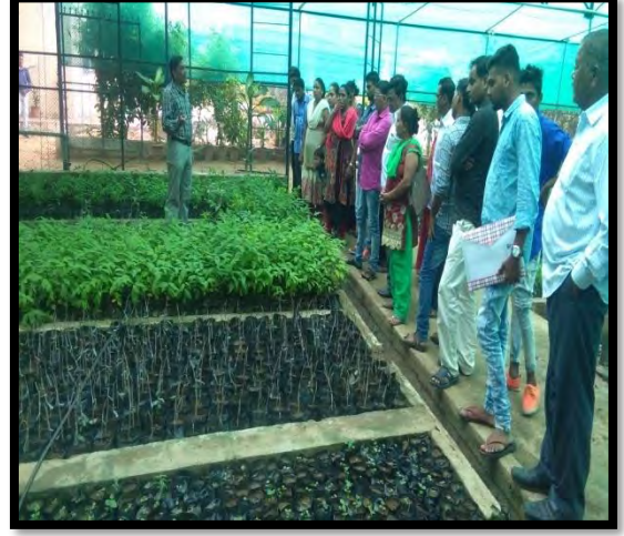
બાગાયત ફાર્મની પ્રત્યક્ષ મુલાકાત