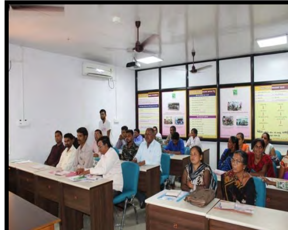
ખેડૂતો દ્વારા તાલીમ વિષેના મંતવ્ય