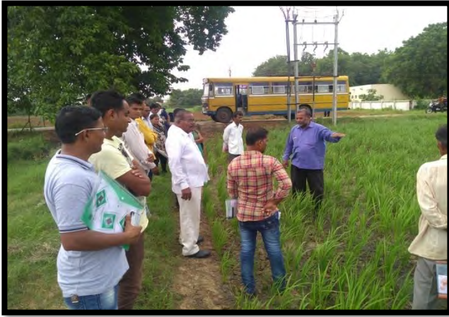
આર.આર.એસ ફાર્મની ખેડૂત તાલીમાર્થીઓ દ્વારા પ્રત્યક્ષ મુલાકાત